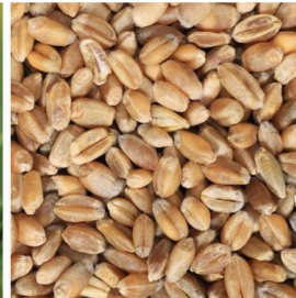
Viljan toimitus Fazer Myllylle