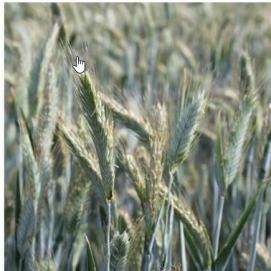
Perushinnat ja laatuvaatimukset